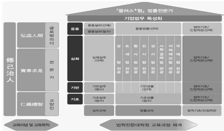
<법학전문대학원 교육과정 종합 체계도>